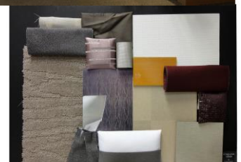
【カラースキーム (さくら)】