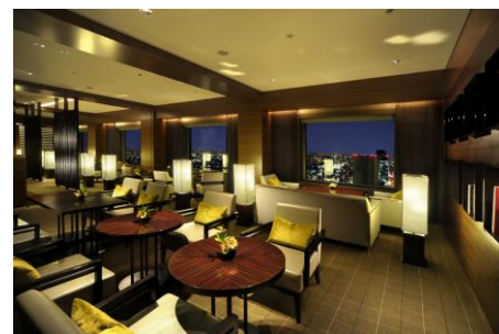
エグゼクティブサロン (35F)