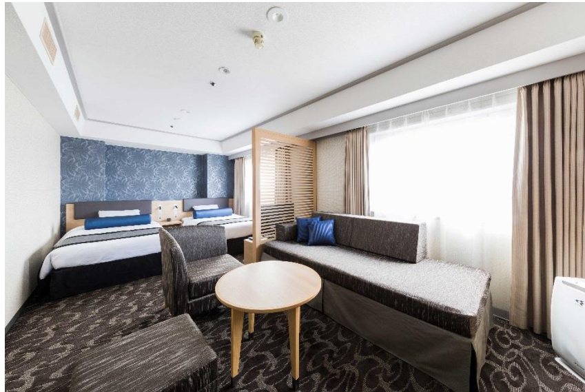
CLASS デラックスツイン

新大阪江坂東急 REI ホテル 13階・14階の客室フロア「S-Class」(102室) 全面リニューアル