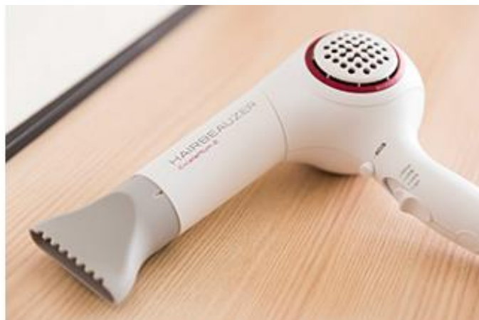
マッサージクッション (左) 美容ドライヤー「リュミエリーナ ヘアビューザー」(右)