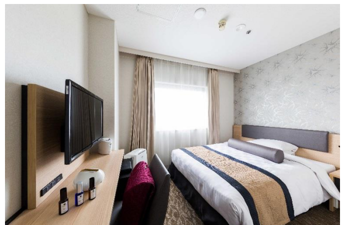
S-CLASS レディスシングル