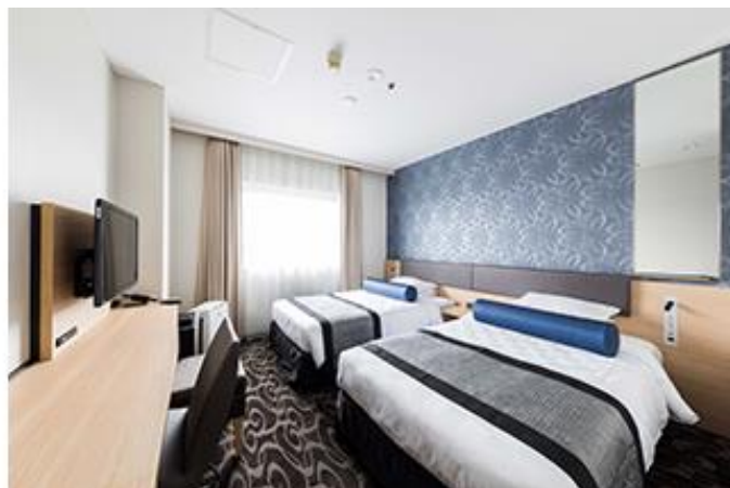
S-CLASS シングル (左) ツイン (右)