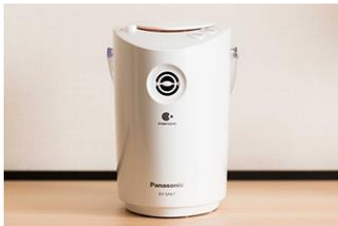
アロマディフューザー (左)・スチーマー「nanoe (ナノイー)」(右)