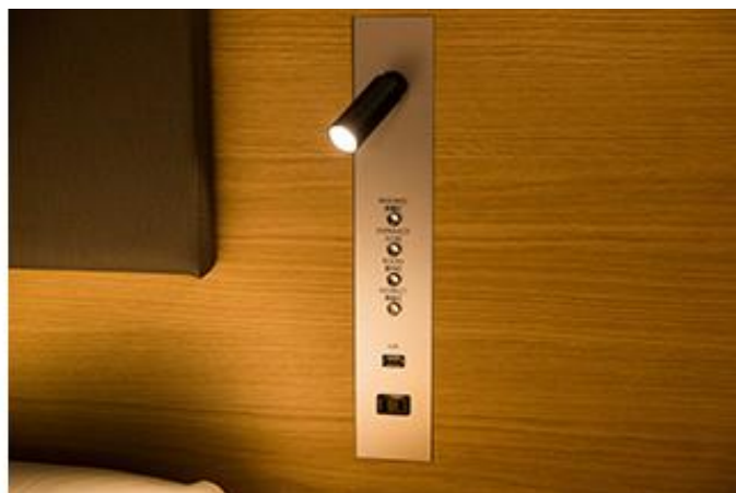
S-CLASS キングサイズベッドダブル (左) ヘッドボードの USB プラグ・読書灯 (右)