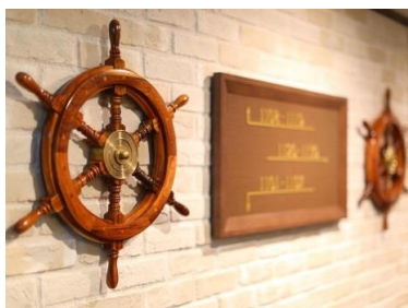
エレベーターホールパネル

神戸港開港をきっかけにさまざまな西洋文化を受け入れたみなとまち神戸。“神戸洋服”と呼ばれ、オーダーメイドで仕立てられる紳士服も神戸を代表するもののひとつです。S-CLASSルームは「テーラーで丁寧に手作業で仕上げられるオーダーメイドの特別感や上質感」そんなイメージをコンセプトにデザインしました。エレベーターを降りた瞬間、目に入る壁掛の船舵装飾がこれから始まる船旅を連想させ、非日常への一歩を誘います。お部屋は落ち着いたあるシックなブラウンと濃紺を基調としたインテリア。ワードローブやTVをパネル化したことでスタイリッシュな雰囲気を醸しつつ、ゆとりのある空間を確保。数分で本格的な味と香りをお楽しみ頂けるコーヒーメーカーも常設し、寛ぎのひとつときをお過ごしいただけます。