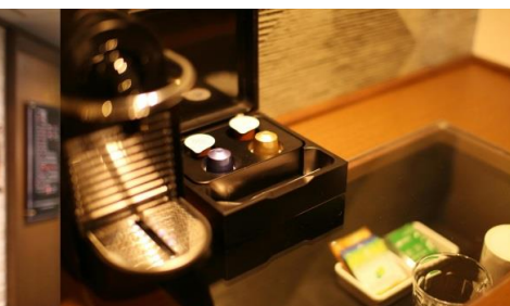
コーヒーメーカー