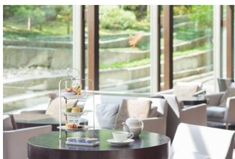
坐忘の閑坐庭を背景に