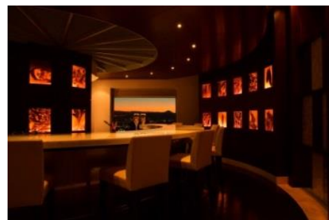
クーカーニョのバーカウンター前