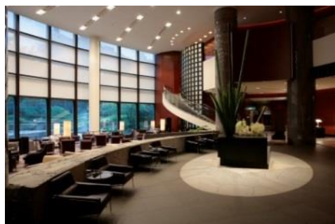
ロビーのいけばなの前