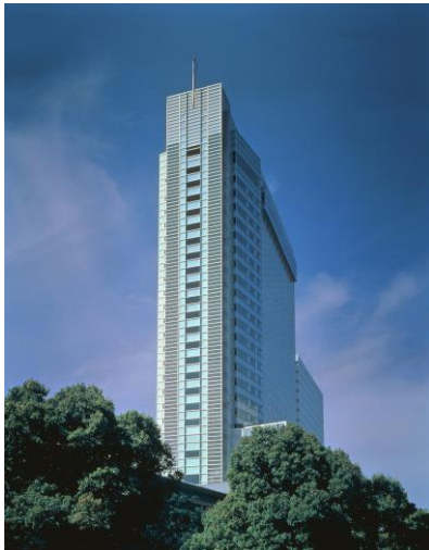
渋谷エクセルホテル東急