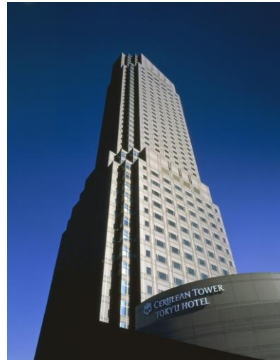
セルリアンタワー東急ホテル