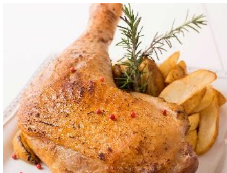
【パフォーマンスメニュー】ターキーのコンフィ