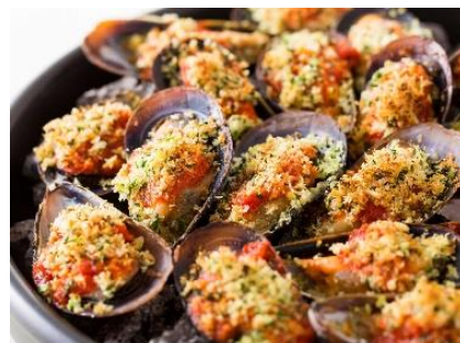
ムール貝の香草パン粉焼き