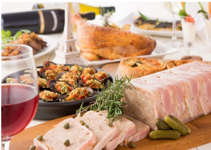
ワインと一緒に楽しんでも♪<ディナーイメージ>

ディナーbuffet<グラン>では、飴色に炒めたたまねぎの風味が、肉の旨みを引き立てる「シヤリアピンスターキ」をはじめ、低温でじっくり仕上げた「ターキーのコンフィ」をパフォーマンスメニューでご用意。デザートにはバレンタイン気分満載のチョコ系デザートや「エクレア」「フレンチトーストのブリュレ」などが並びます。人気のチョコレートファウンテンもチョコ&ストロベリーに変身し、キュートなピンク色に！前菜からメインまでお気に入り或少しずつ集め、お皿で自分だけのコース気分を楽しんでも、ワインと一緒に、ちょっとスペシャルな女子会を楽しむのもオススメ★