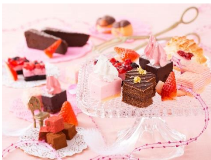
バレンタインがテーマのスイーツ達