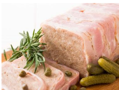
パテ ド カンパーニュ 田舎風パテ

<グラン>“パフォーマンスコーナー”では、シェフが目の前で焼き上げる「シャリアピンステーキ」をご用意。たまねぎで漬け込み、柔らかく食べやすいようアレンジした日本発祥の一品です。(※下記参照)低温の油でじっくり調理した「ターキーのコンフィ」や「ムール貝の香草パン粉焼き」「ビーフストロガノフ」など本格派の味わいとともに、フランス料理の世界をご堪能ください。