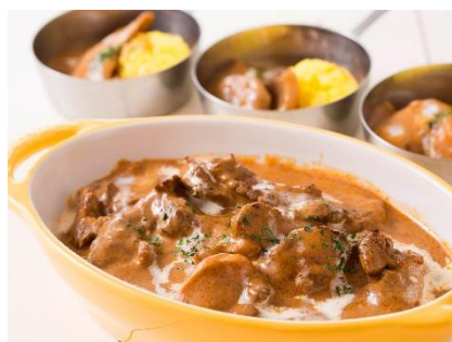
ビーフストロガノフ