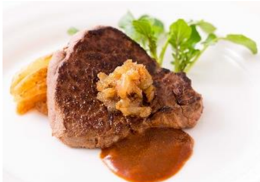
【パフォーマンスメニュー】シャリアピンステーキ

たたいて薄くした牛肉をすりおろしたたまねぎに漬けて焼き、たまねぎのみじん切りと肉汁で作るソースをかけたビーフステーキ。玉ねぎのタンパク質分解酵素の力が、お肉をやわらかくしてくれるので食べやすいのが特徴。別名「マリネ・ステーキ」とも呼ばれています。