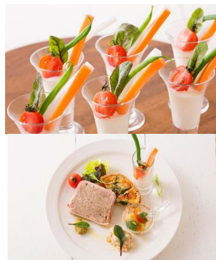
好きなものを選んで自分だけのコース気分♪