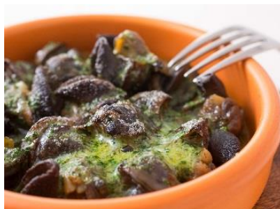
エスカルゴのブルギニョン