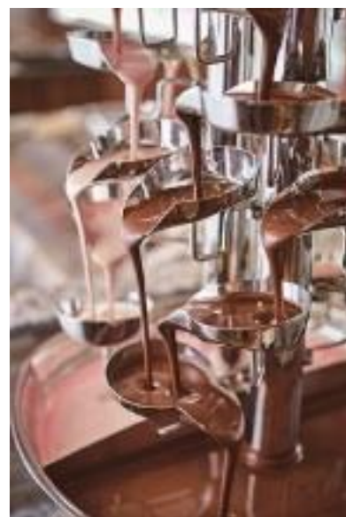
2色のチョコレートファウンテン (イチゴ&チョコ)