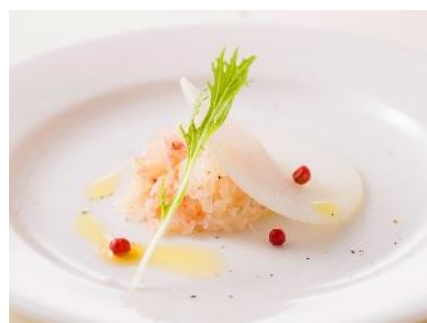
【ディナー限定】ウェルカムディッシュ