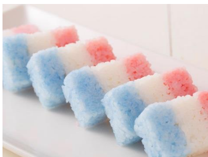
トリコロールのカラフル寿司