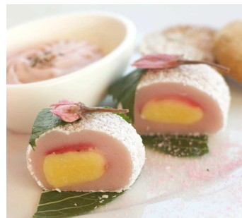
※桜スイーツイメージ