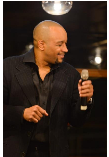
ドゥエイン・スパイサー

現在は日本全国においてレベルの高いプロミュージシャンとのコラボレーションや、コンサートのプロデュース・パフォーマンスも行っている。