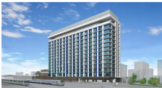
▲外観イメージ（富士山側）