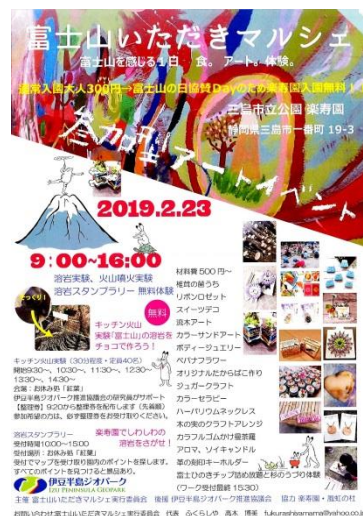
▲「富士山いただきマルシェ」チラシ