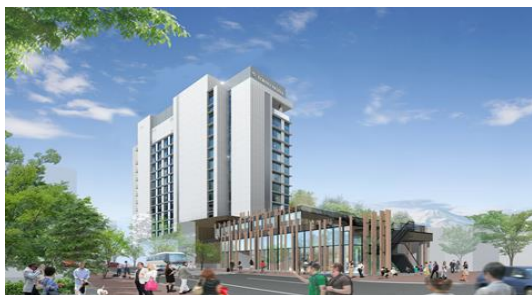
▲外観イメージ（楽寿園側）