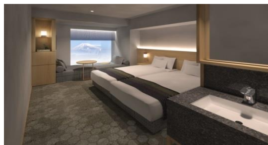
▲客室ツインタイプイメージ