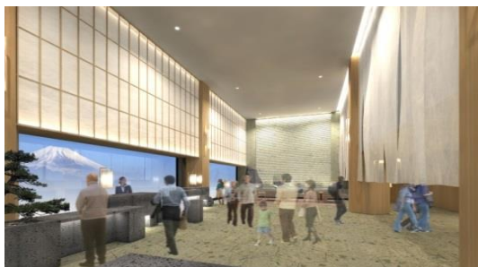
▲2階ロビーラウンジイメージ