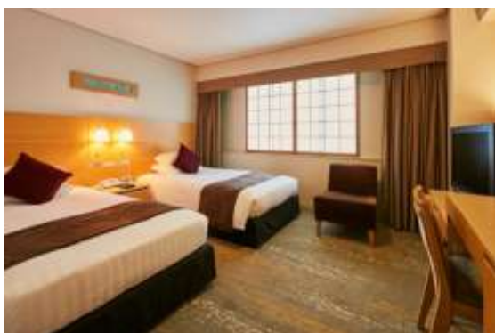
客室一例：スタンダードツインルーム