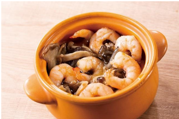
茸とガンバスのアヒージョ

オニオンスープ チーズクルトン添え / クミン香るコールドキャロットスープ / カツオのたたき カルパッチョスタイル / 窯焼きピッツア各種 / ソフトドリンク / フルーツ・デザート各種