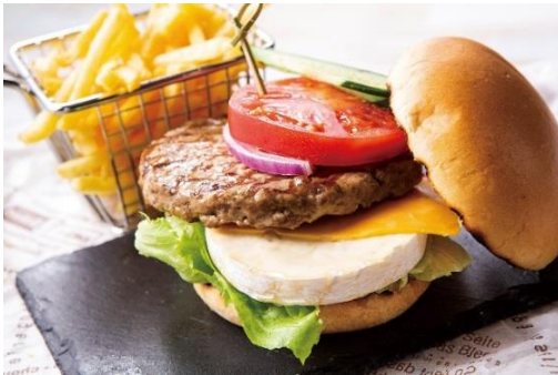
国産牛のBLTダブルチーズバーガーフレンチフライ添え