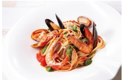
リングイネの漁師風“ペスカトーレ”