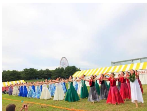
フラサークル「フラ オハナラウレア」