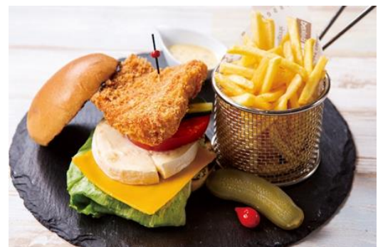
金目鯛バーガー フレンチフライ添え