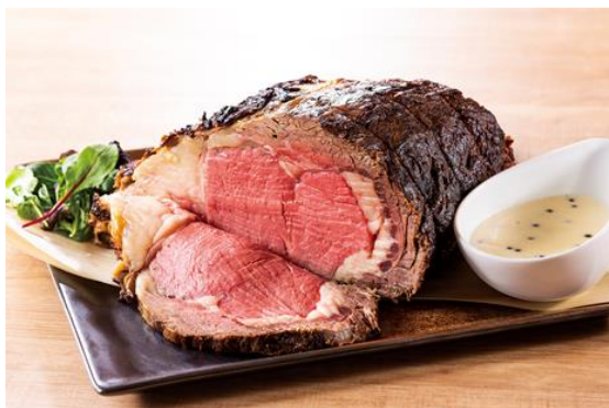
ローストビーフ グリーンペッパー クリームソース