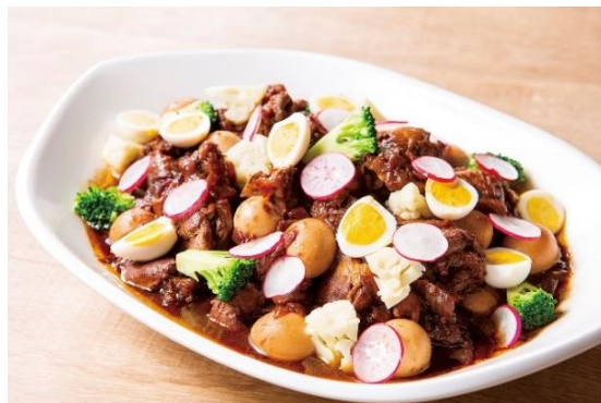
鶏手羽元のマリネ煮込み アドボ マノック