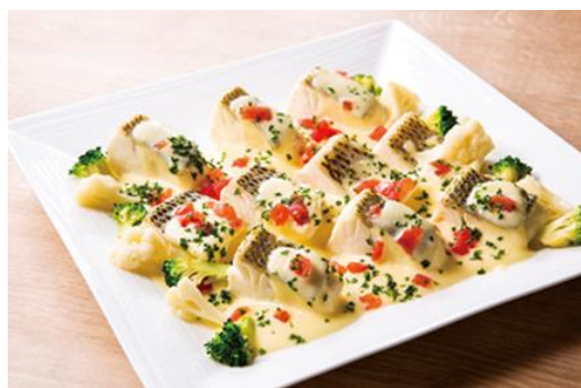
ポルトガル風 スズキの白ワイン蒸し