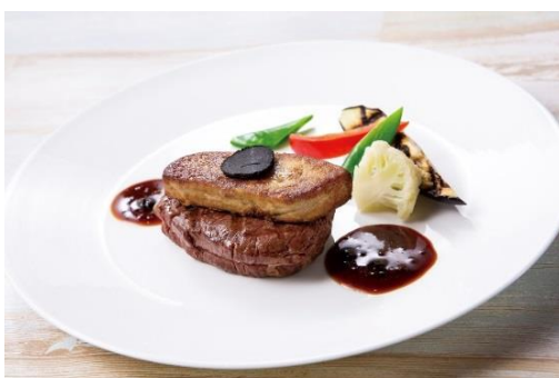
牛フィレ トルネードロッシェニ風