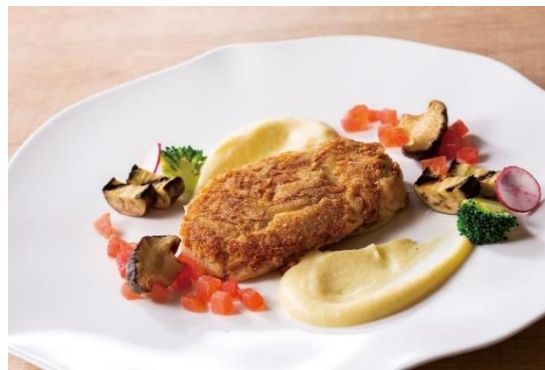
サバのフィッシュケーキ バルサミコとバジルソース