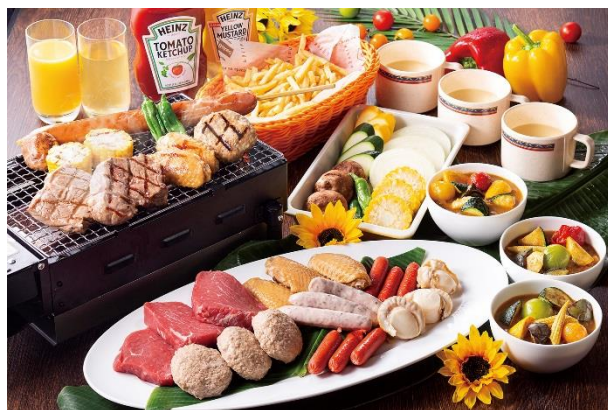
*ファミリーセット イメージ

オーストラリア産牛サーロイン マジョラムソーセージ、赤ウィンナー ミニハンバーグステーキ、鶏手羽中和風マリネ ボイル帆立貝、野菜各種、フライドポテト、 冷たいコーンスープ、夏野菜のスープカレー&ライス ミニアイスバー