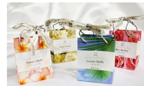
バスソルトイメージ