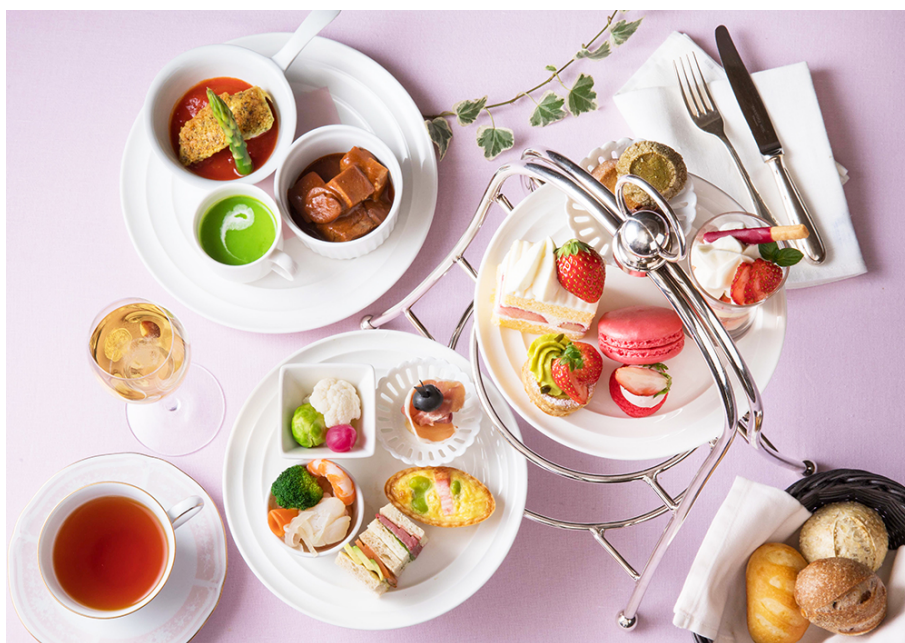
「いちごハイティー」イメージ

観覧車のイルミネーションとともに、みなとみらいの夜景をご覧いただける「ハイティー」が登場！ スイーツはもちろん、シェフおすすめのお料理も一緒にお召し上がりいただけます。 グラスシャンパン付きで、優雅なお茶会をお楽しみください。