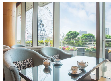
「ソマーハウス」内観イメージ