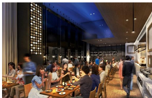
レストラン ビストロチャイナ「ENCORE」