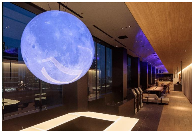
月の照明が印象的なロビー

新たな開業日を目指して一層の準備を進めてまいります。ぜひ、横浜東急 REI ホテルにご期待ください。