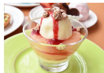
「ピーチメルバ」イメージ