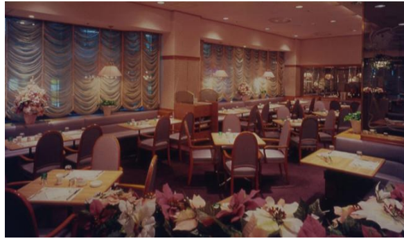
※銀座東急ホテル レストラン「O-24 (オーツーフォー)」