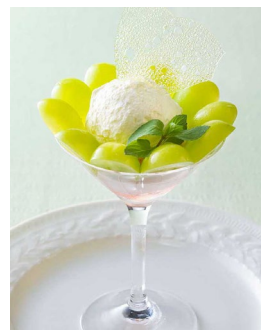
「シャインマスカットパフェ」