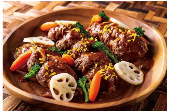
ステーキアッシュェ 茸入りデミグラスソース