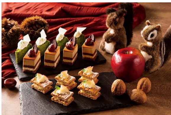
デザートイメージ