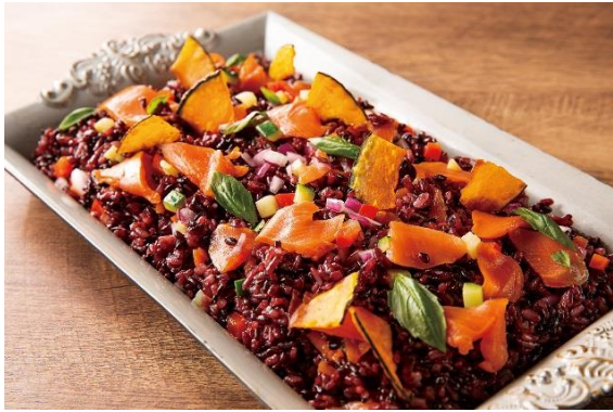
スモークサーモンと黒米のサラダ