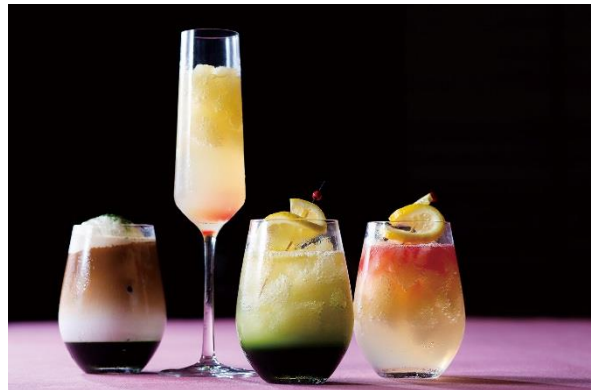
オプションドリンクイメージ(¥800~)