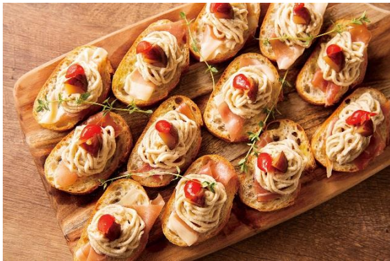
生ハムのタルティーンズ モンブラン仕立て