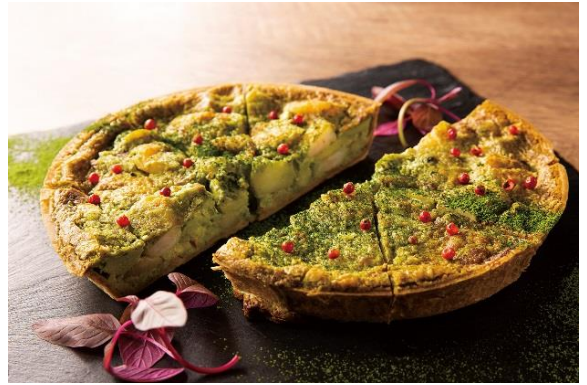
シュリンプと抹茶のセイボリータルト