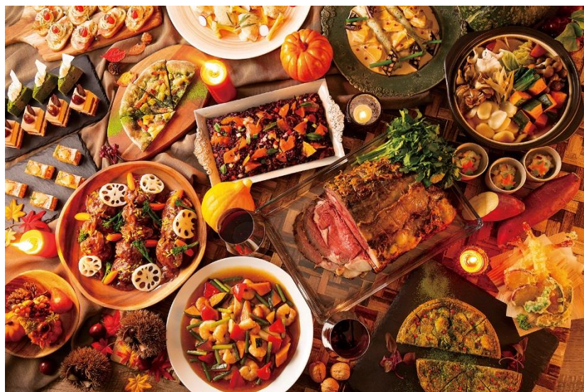
ディナーbuffetイメージ

食欲の秋にぴったりの旬の食材「いも・栗・かぼちゃ・抹茶」を使った和・洋・中の創作料理とホテルパティシエ特製のスイーツの数々。ビタミンやミネラルの栄養たっぷりの女性に人気の“秋メニュー”をどうぞお楽しみください。