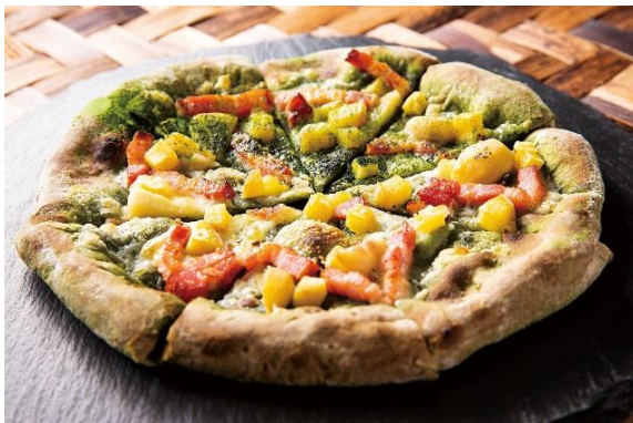
栗とさつまいものピッツァ 抹茶の風味