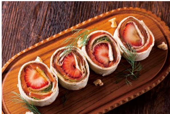
スモークサーモンといちご ヌテラとクリームチーズのルーロー