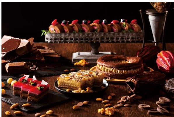
デザートイメージ