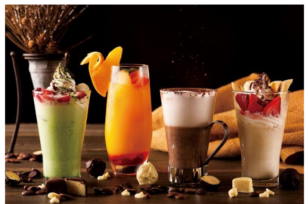
オプションドリンクイメージ(別料金 ¥800~)