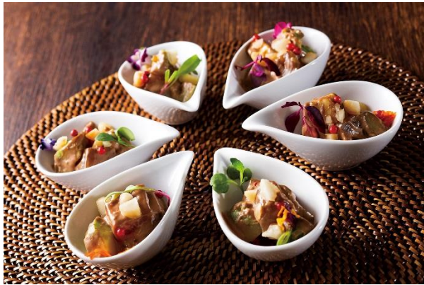
マグロのマリネとアヴォカドのメランジェ ミ・アメールソース