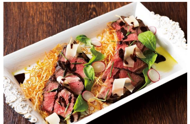
牛肉のタリアータ ショコラ香るバルサミソース (ランチのみ)