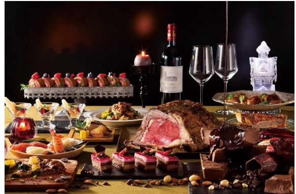
ディナーbuffetイメージ