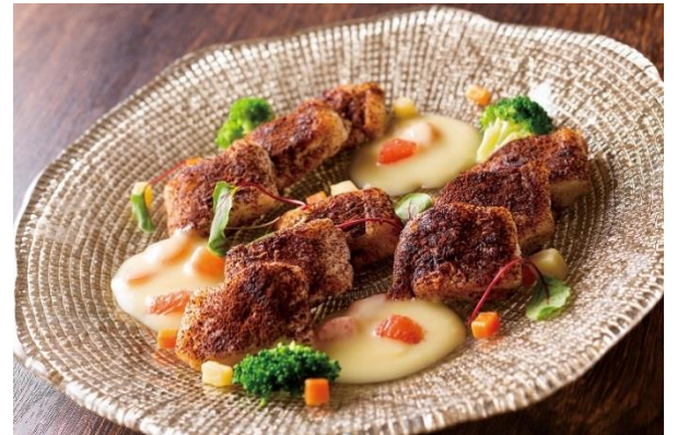
白身魚のムニエル ココア風味柑橘バターソース (ディナーのみ)