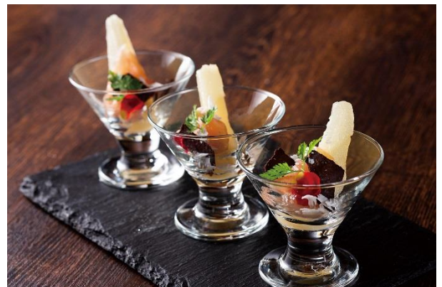
生ハムと洋ナシとジャンドゥーヤ カカオのコンディマン