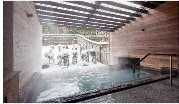
ホテル内露天風呂