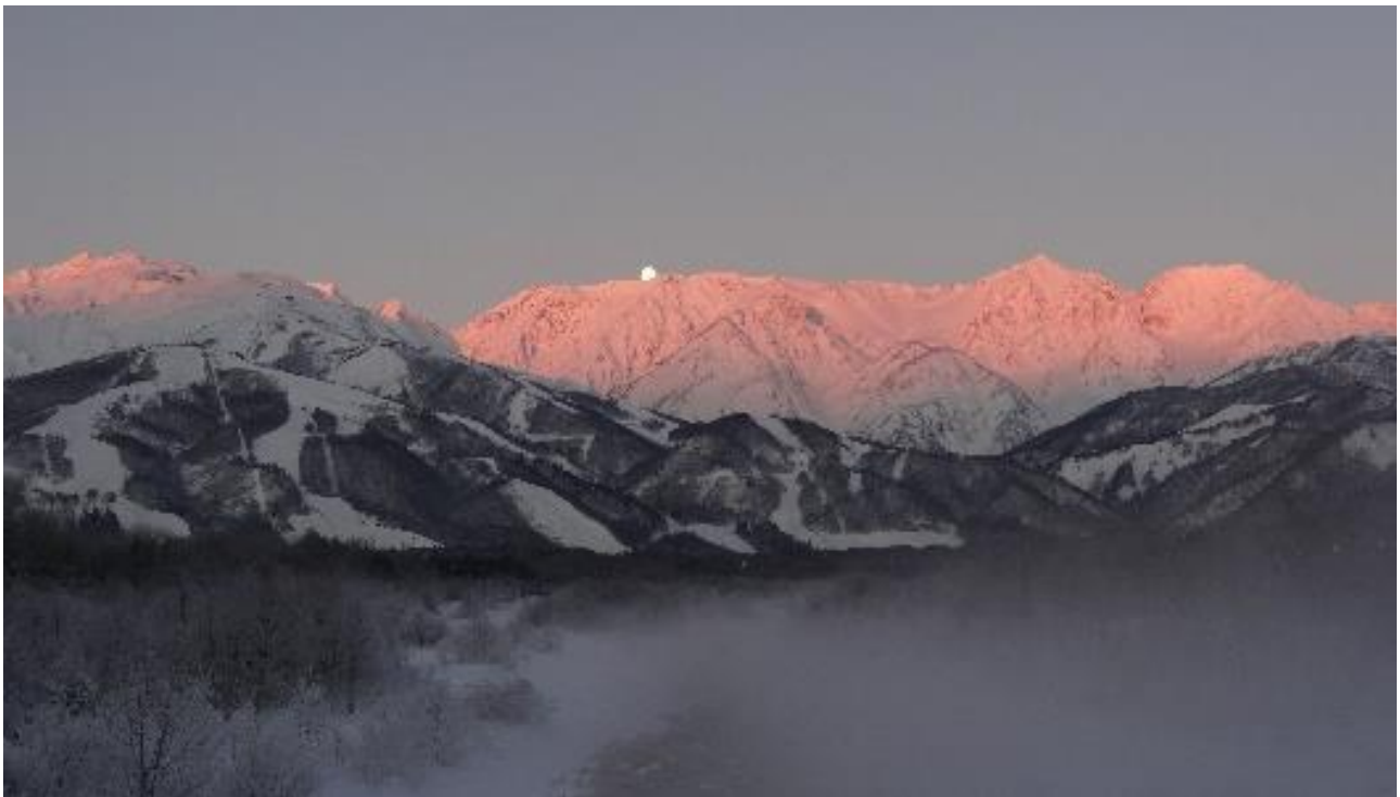
ここでしか味わえない貴重な体験 息を飲む北アルプスの Morgenrot