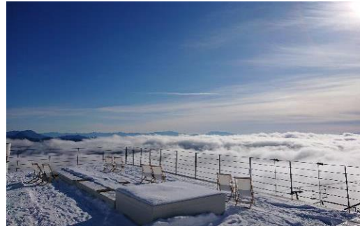
冬の白馬は 絶景ポイント満載