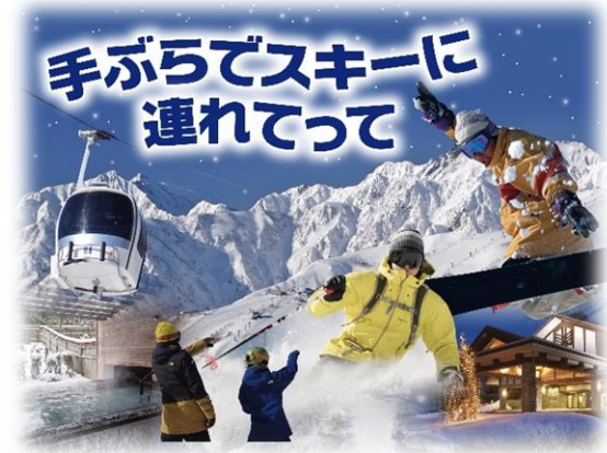
宿泊プランイメージ