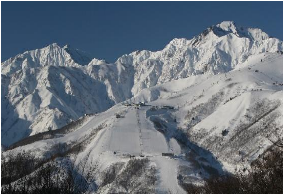
ホテル最寄りスキー場は「Hakuba Valley Ski Area」 の中心とも言える「八方尾根スキー場」