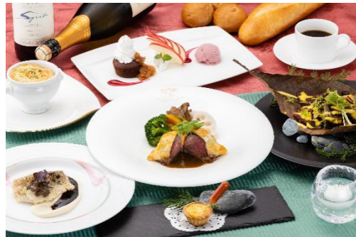
夕食はちょっと贅沢なホテルディナー (和食会席もチョイス可)