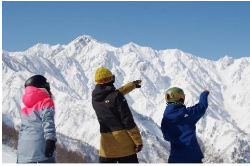
若者に人気の HAKUBA 47 スキー場 も ホテルから簡単にアクセス可能