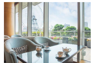
ラウンジ「ソマーハウス」内観

◇横浜ベイホテル東急では、お客さまの安全と健康を第一に、新型コロナウイルス感染防止対策に最善を尽くし取り組んでまいります。詳細はホテル公式ホームページをご覧ください。 https://ybht.co.jp