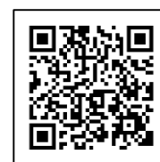
LC 厳選ブランド アイテムリスト

[内容] ご宿泊 / LC 厳選ブランドアイテムの体験(詳細は右記 QR コード参照) / 本プラン限定ザ・キャピトル アフタヌーンティー / トリュフオムレツを含むご朝食(ルームサービス) / ザ・キャピトル バーにてカスクエイジタイプのジン 「季の美 エディション G exclusively blended for LUXURY CARD」の ジントニックをお1人さま1杯サービス 他