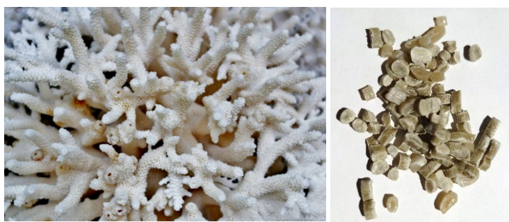
原料となる白化した養殖サンゴとペレット