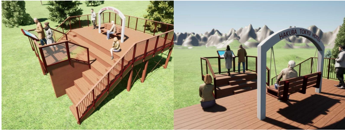
エントランスで山小屋風ディスプレイにも活用