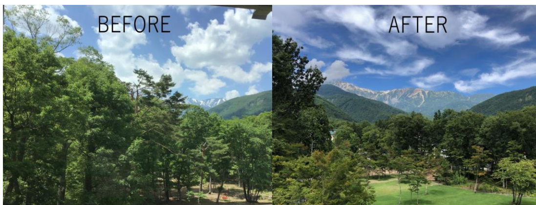
伐採前と伐採後の客室からの眺望一例（4階客室）

伐採した木は合計 107 本。これらの大切な資源は、ホテル内の暖炉で薪として有効活用いたします。