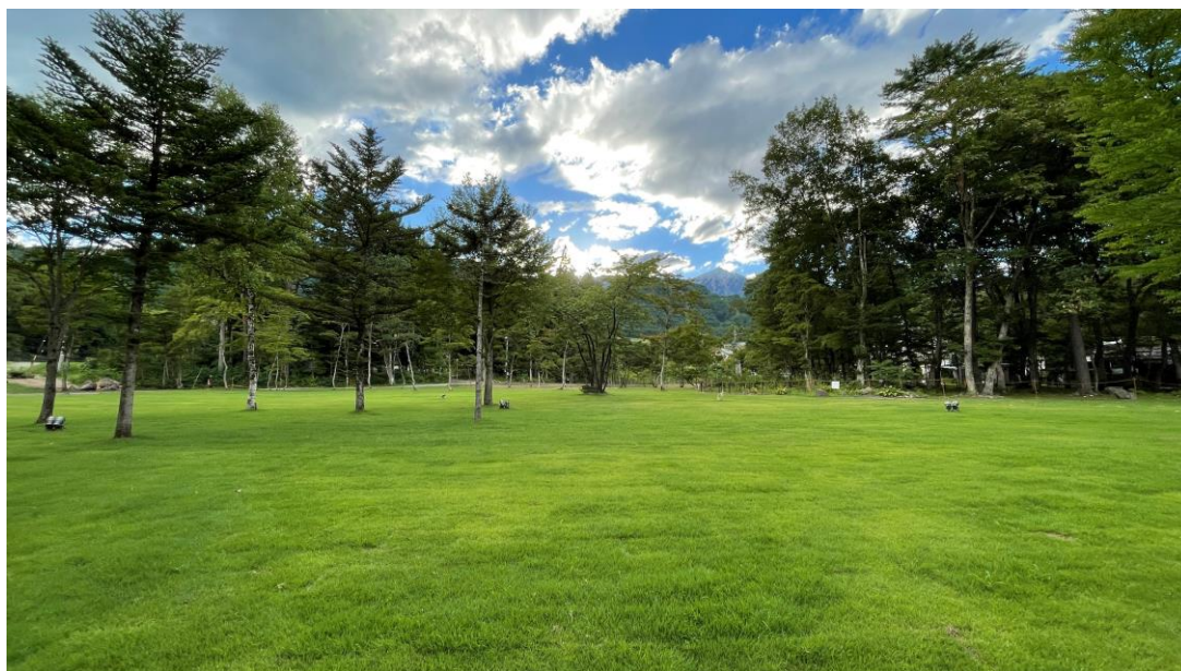
思わず走り出したくなる芝生のガーデン

案内ページ: https://www.tokyuhotels.co.jp/hakuba-h/information/45074/index.html