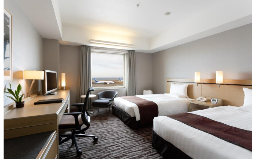
プレミアムツイン