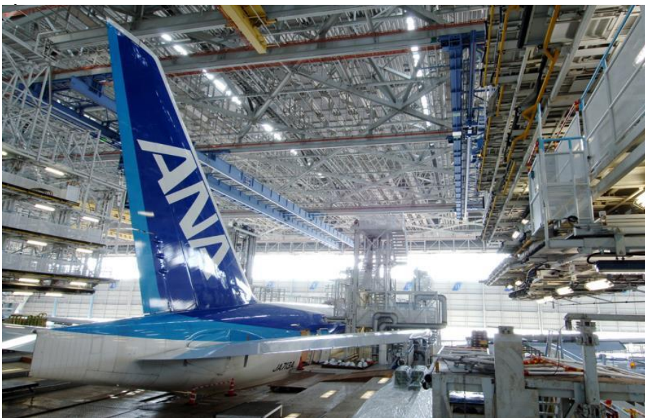
ANAエアフレームメンテナンスビル

昼食付きの本プランでは、土日祝日限定開催の、“フライヤーズランチbuffet”を組み込み、開放感溢れる大きな窓から駐機している飛行機を眺めながらランチをお楽しみいただけます。宿泊は、晴天なら東京湾の先に房総半島を望み、窓から離発着や駐機している飛行機を間近に見ることができる滑走路側の客室をご用意。リピーターも多く、早々の完売必至の当プランをご利用ください。