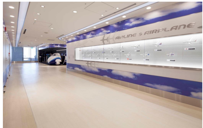
羽田空港国際線旅客ターミナル「TIAT Sky Road」