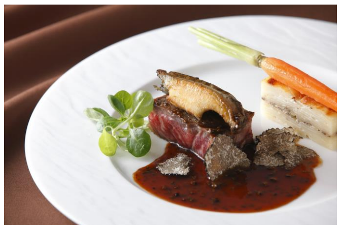
黒毛和牛ロースと鮑のボワレ トリュフ薫るソース・ペリグー