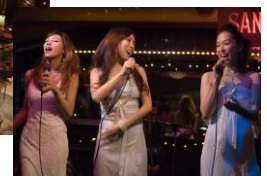
吹き抜けの空間が心地良いアトリウムラウンジ で楽しむライブステージ