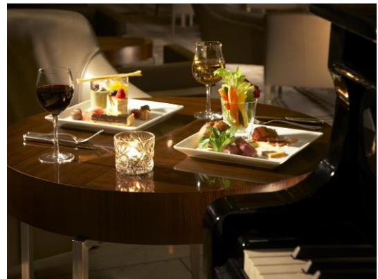
毎年人気のクリスマスライブ&buffet