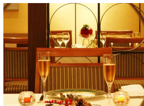
温かな空間と一流のおもてなしで心に残るクリスマス