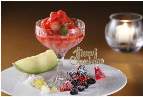
ブランデーが香るジューシーなイチゴのフロズンカクテル