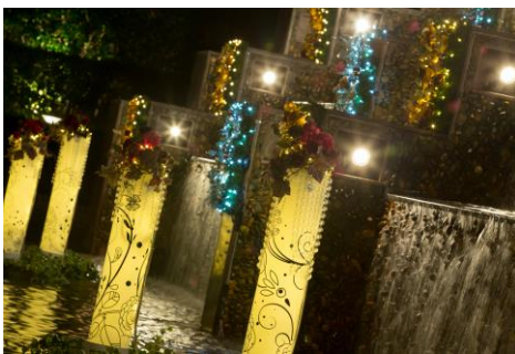
窓から見えるロマンティックなイルミネーション