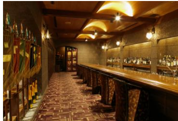
食事の後は気品に満ちたオーセンティックバーで特別な夜を