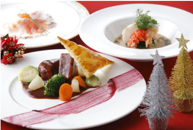
「クリスマスナイト2016」スペシャルディナー