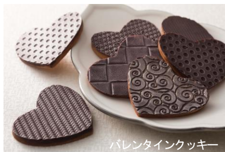
バレンタインクッキー