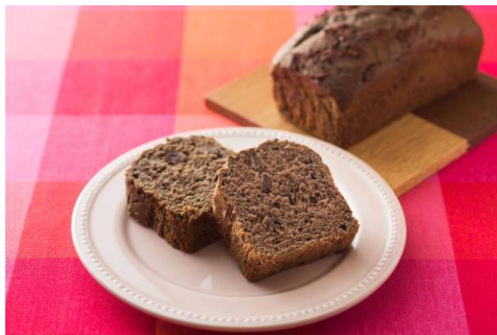
チョコバナナブレッド

ザ・キャピトルホテル 東急 マーケティング : 川邊(かわべ) Tel : 03-6206-1576(マーケティング 直通) E-Mail : capitol-h.mk@tokyuhotels.co.jp