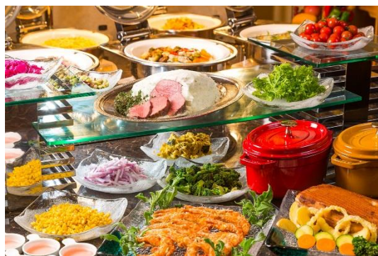
ブッフェ料理 イメージ

ワイン（赤・白）、サワー各種、果実酒各種、ハイボール、焼酎（芋・麦）、ウイスキー ソフトドリンク各種