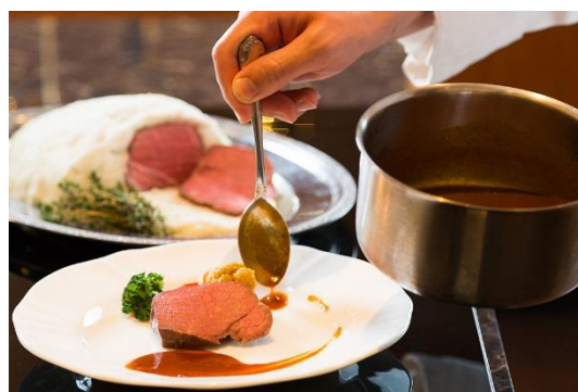
ローストビーフ イメージ