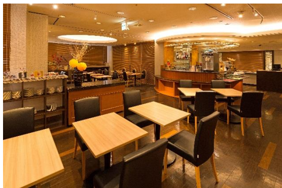
レストラン「ピノモンテ」店内

※2015年4月1日、(株)東急ホテルズのブランド再編に伴い、松山東急インから名称変更