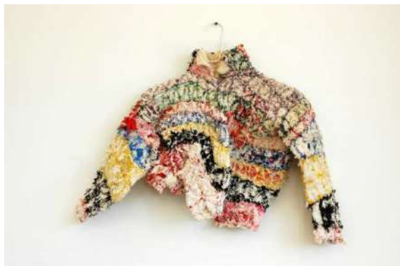
nui project (参考作品)