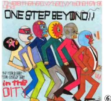
マスカラ・コントラ・マスカラ 《覆面とロック（レコジャケシリーズ）》 2016年～2017年 アート