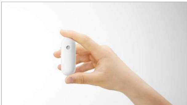
本多達也 《Otonna (オンテナ)》 2019年 プロダクトデザイン

音の特徴を振動と光に変換できる装置。髪や襟元などに身につけることによって，あらゆる人々が，さまざまな音をからだでとらえて楽しむ，新しい体験ができる。