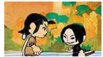
『この砂赤い赤い タノタフレ』 （公財）アイヌ民族文化財団制作

アイヌの伝承をもとにしたアニメーションと、2020年4月、北海道白老町にオープンする「ウポポイ（民族共生象徴空間）」のコンセプトムービーを上映します。