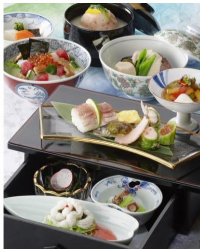
和食堂 山里 (紫陽花)