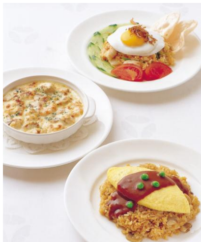
カフェテラス カメリア (日替わりランチ)