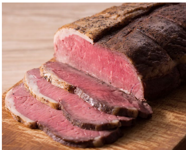
国産牛ローストビーフ

※One Harmony 会員特典（5%OFF）、プレミアムセレクション特典（10%OFF）による割引は対象外となります。