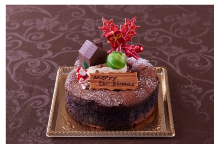
ガトーショコラクラシック