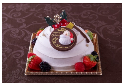
クリスマスショートケーキ