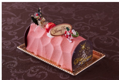
ノエルショコラルージュ