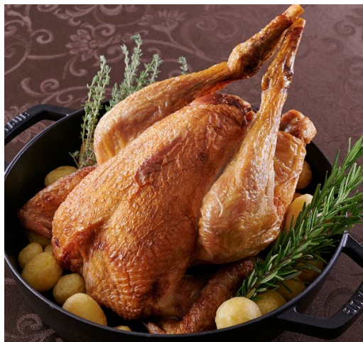
ローストチキン「はかた一番どり」