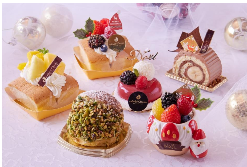
クリスマス期間限定スイーツ