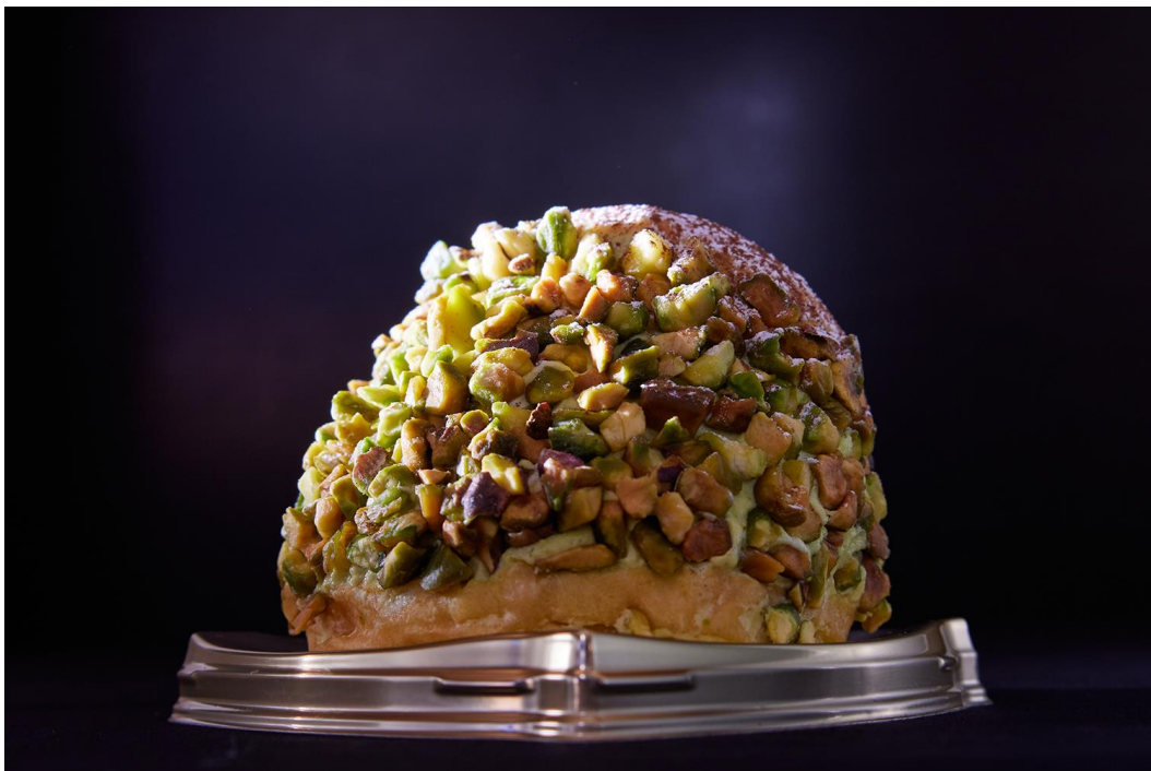
シーズン「ピスタチオのマリトッツォ」

ホテルオークラ東京ベイ（千葉県浦安市舞浜1-8：代表取締役社長 総支配人 美濃地 誠）では、カフェレストラン テラス売店にて、今年のトレンドスイーツとして話題の「マリトッツォ」を販売しております。4月の発売開始以来、多い日では1日に150個以上を売り上げる当ホテルのマリトッツォに、このたび、冬季限定の新フレーバーとして2021年11月9日（火）から12月25日（土）までの期間、ピスタチオ好きには堪らない『ピスタチオのマリトッツォ』が登場いたします。