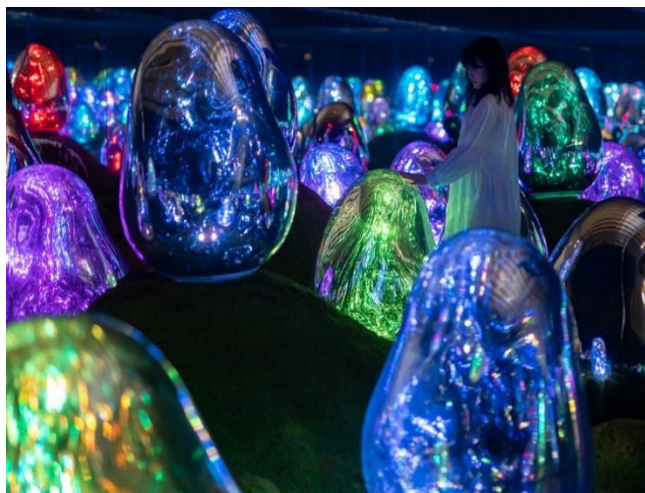
teamLab Planets TOKYO