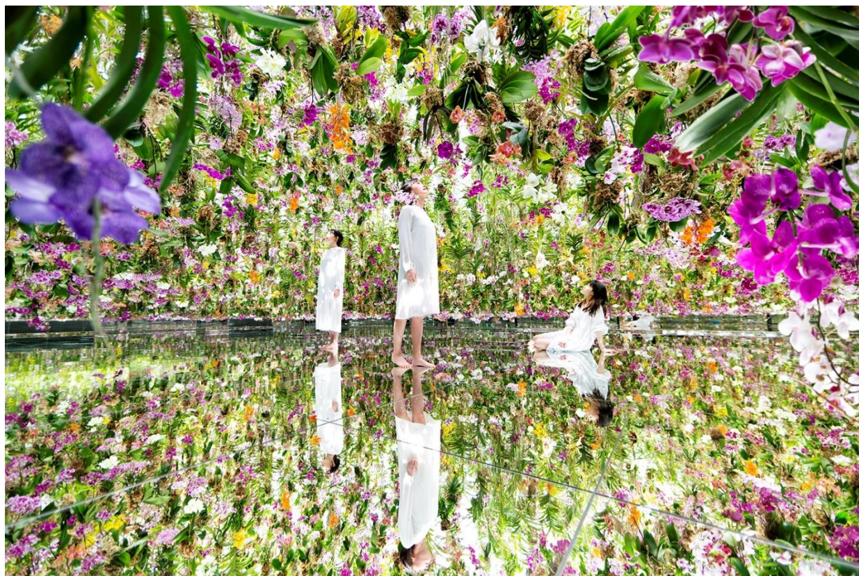
Floating Flower Garden

ホテルオークラ東京ベイ（千葉県浦安市舞浜 1-8：代表取締役社長 総支配人 美濃地 誠）は、東京・豊洲にある「チームラボプラネッツ TOKYO DMM」の入場チケット付き宿泊プランを2021年11月19日（金）から販売いたします。