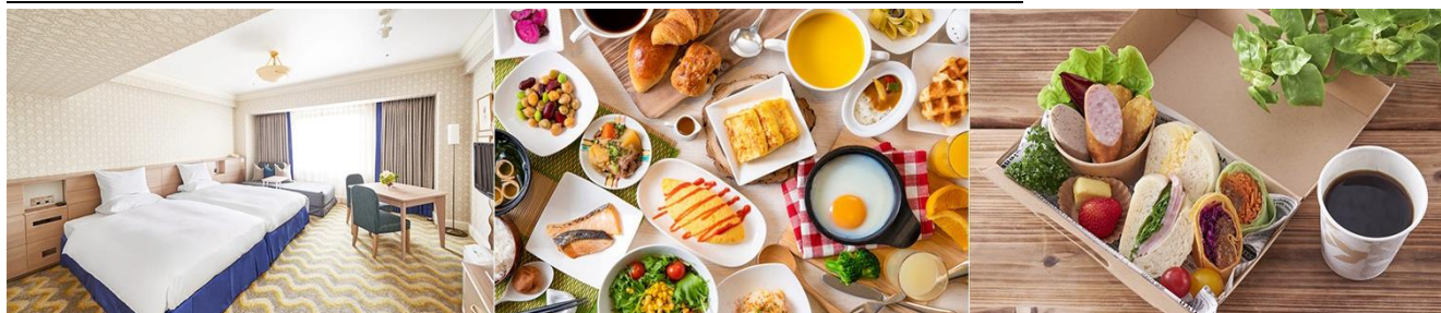
左から：スーペリアルーム、レストランでの朝食、モーニング BOX