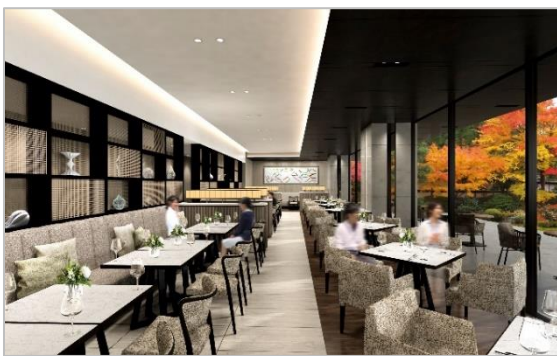
ヌーヴェル・エポック 内観

E-mail:fb@okazakibettei.hotelokurakyo.com