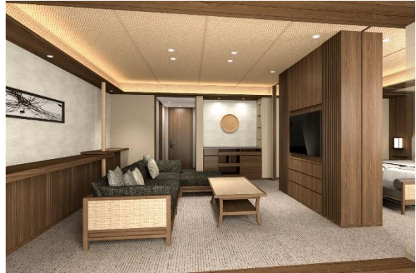
スイートルーム (70 m 2 )