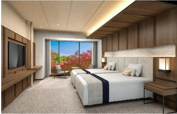
ガーデンルーム (40 m 2 )

また、客室廊下に設えたルームナンバーが記された照明は、手作りの茶筒では日本で一番古い歴史を持つ「開化堂」の茶筒と同様の製法で作られており、時とともに深みを増す経年美化を感じられます。