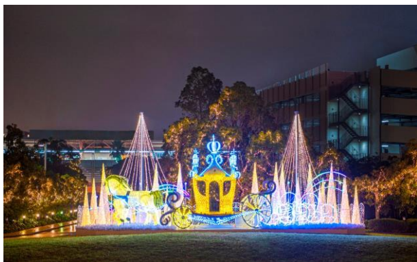
【輝きの馬車】物語の世界から抜け出したような光り輝く馬車