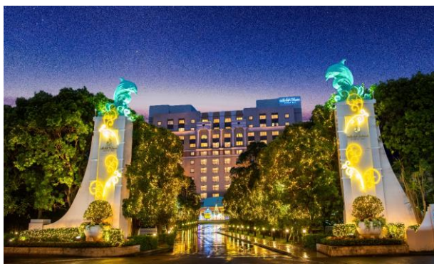
【シャンパンゲート】シャンパンをイメージしてイルミネーション装飾されたイルカの門柱と並木道

ホテルオークラ東京ベイの特徴的な中庭「コートヤード」。中央の噴水をきらめく大きなケーキに見立てました。4本の立木にはキャンドルのようにやわらかな明かりを灯し、瞬く星空の下でアニバーサリーを象徴します。今日という日の、記念すべきパーティーにふさわしいモニュメント。すべては、お客様の特別な1日のために。