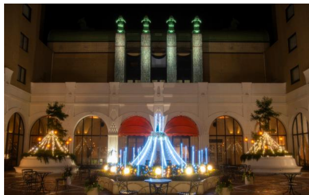
【アニバーサリーケーキ】ケーキに見立てたイルミネーション