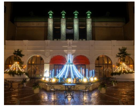
アニバーサリーケーキ