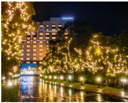
シャンパンゲート