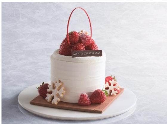
ラヴィアン・ネージュ