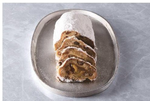
りんごとメープルのシュトーレン

さわやかな風味の辛口シードルとアマレットにしっかりと漬け込んだドライりんごに皮付きアーモンドを纏わせ、包み込むように焼き上げました。香りと甘みが豊かなメープルシロップを使用し、生地に練り込むだけでなく、メープルブラウニーを加えることでその香りをしっかりと感じられるように仕上げました。ギフトにもおすすめのミニサイズです。