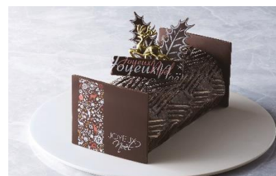
ブッシュ・ド・ノエル ル・ファゴ