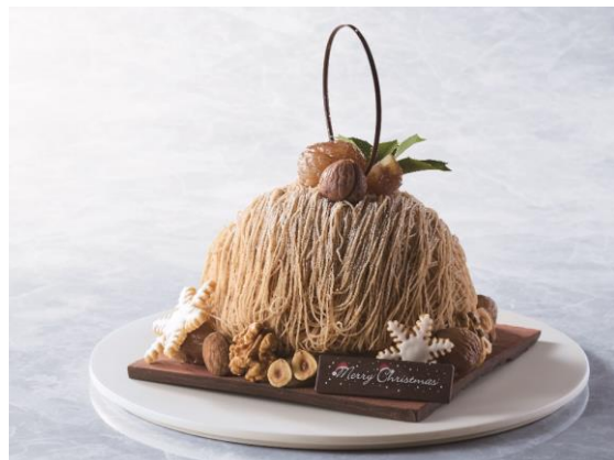
フランスに包まれて～emballé en France～