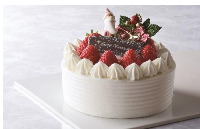
クリスマスショートケーキ