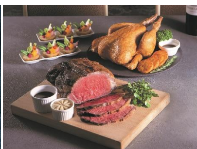
ローストビーフ / ローストチキン