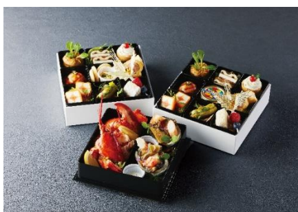
クリスマスオードブル