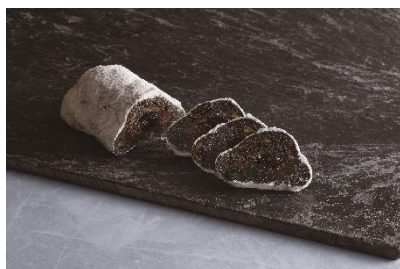
ショコラーデ・シュトーレン