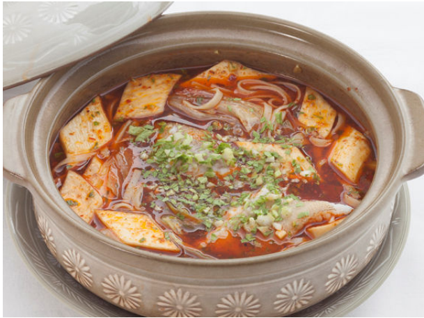
鮮魚と沙河粉の強辛土鍋煮込み ¥2,730