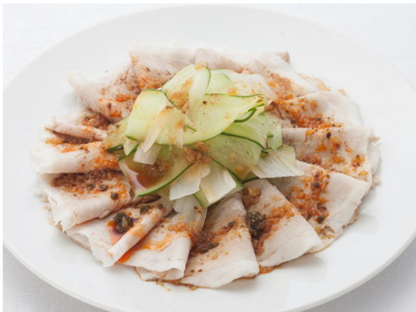
味麗豚 冷製薄造りニンニクソース ¥2,100