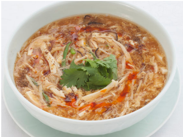
強辛サンラータン麺 ¥1,365