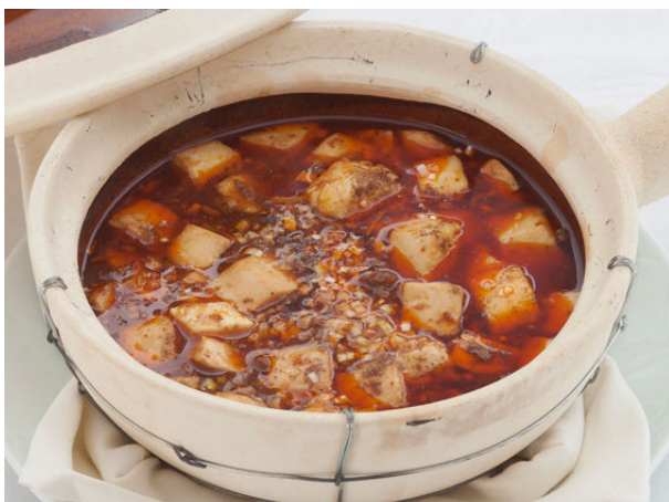
四川風 麻婆豆腐 土鍋煮込み ¥1,785