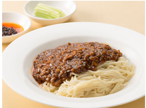
強辛ジャージャー麺 ¥1,365