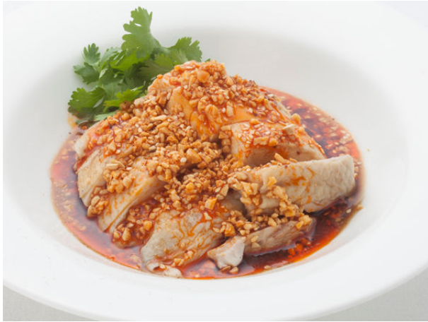
よだれ鶏 桃花林風 ¥2,100

【実施期間】2013年6月25日(火)～8月31日まで (※8/10～16を除く)