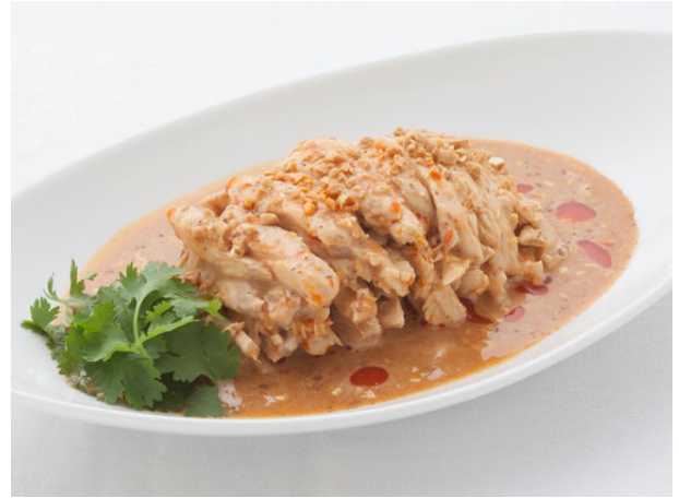
つくば鶏細切り強辛胡麻ソースかけ ¥2,310