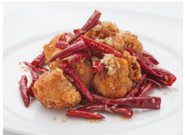
つくば鶏の唐揚げ 山椒・唐辛子風味 ¥1,785