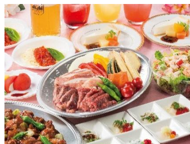
華の女子会プラン