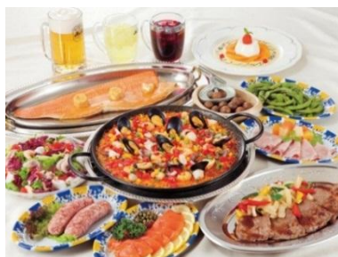
ラグジュアリープラン