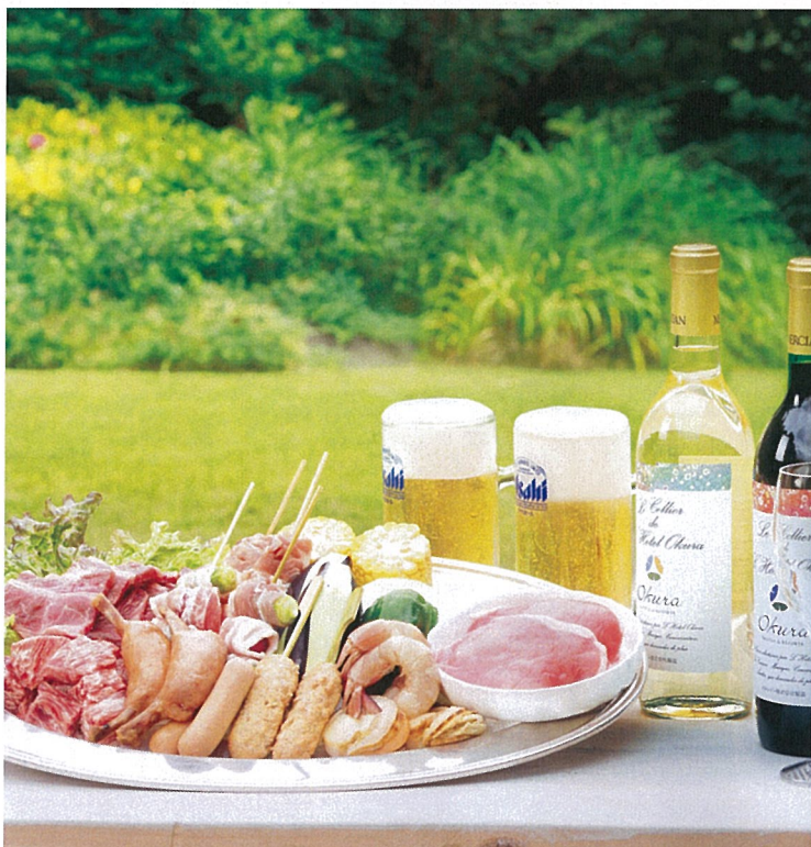
備長炭で焼く料理長自慢のセットメニュー。目の前のBBQにお子様も大喜び