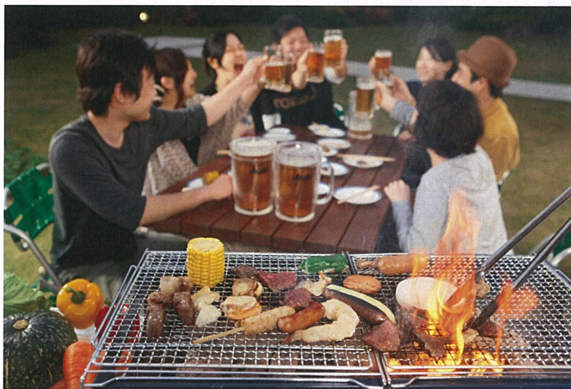
緑と水に囲まれたリゾートホテルで夏の思い出を！ ファミリーはもちろん、会社の同僚やグループの暑気払いにもオススメです