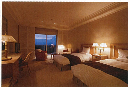
広い客室はファミリーユースにも最適♪