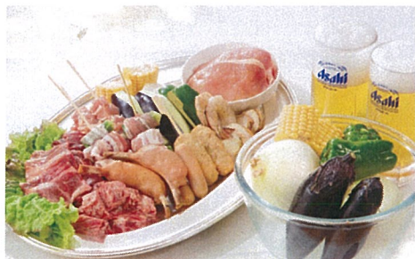
料理長自慢のセットメニューの人気はこだわりのお肉