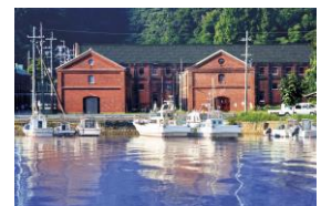
舞鶴赤れんがパーク

赤れんが倉庫群や外航クルーズ船の寄港地である舞鶴港を擁する。「舞鶴赤れんがパーク」ではライブイベントやアートフェスタなど多数の催しが開催されている。