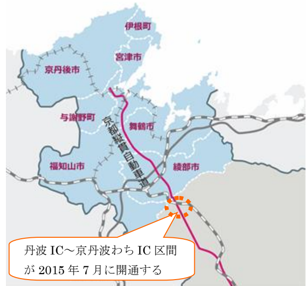
海の京都観光圏の7市町

7つの市町では、観光圏の認定を受けて、「海の京都」という統一テーマのもと、「海」という大きな魅力と「京都」というブランド力を活かして、観光地域づくりを一体となって進めてきた。7月に京都縦貫自動車道全線開通となる今年は「ターゲットイヤー」と位置づけられ、7月18日（土）～11月15日（日）の期間「海の京都博」と題し歴史、文化、自然の恵みなどの魅力を全国に発信する大型イベントが開催される。