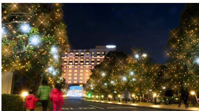
【並木道】お客様を誘うような緩やかな光の演出