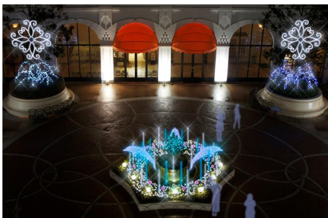
【コートヤード】客室からの眺めが一層ロマンチックに