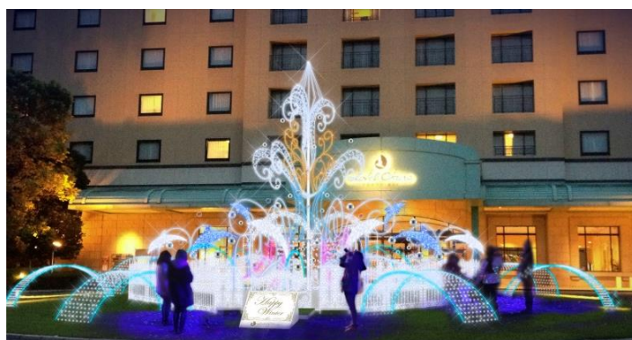
【玄関前芝生】オブジェの前は一番のフォトスポットに