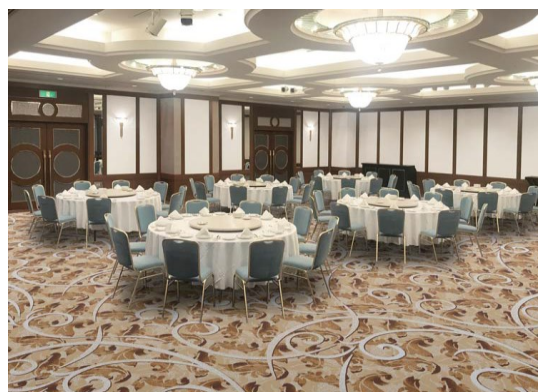
曲水 完成イメージ

(*)2019年6月 公益財団法人 京都文化交流コンベンションビューロー発表資料に基づきます。