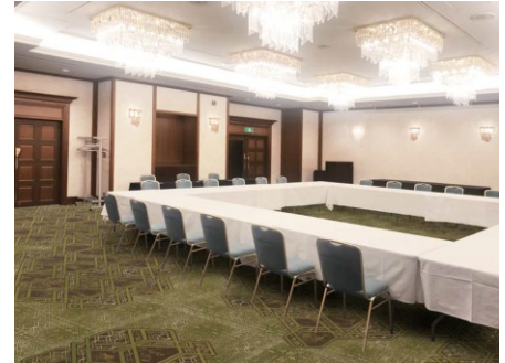
金剛 完成イメージ