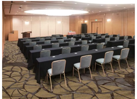
光舞 完成イメージ

濃い茶色をベースに、四季の花や葉を表現した大小のモチーフをイエローで大胆に配しております。宴会場名「光舞」にふさわしく、シャンドリアのやわらかな光を受けた模様が、花のブーケや木漏れ日など、見る人の想像によりそのイメージを変化させます。