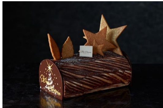
左：今も保存されているブッシュ・ド・ノエルのレンピ図解（一部）。受け継がれる伝統と現代の感性が融合され、The Okura Tokyo の製菓の歴史が新たに紡がれる。