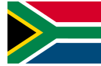
南アフリカ共和国