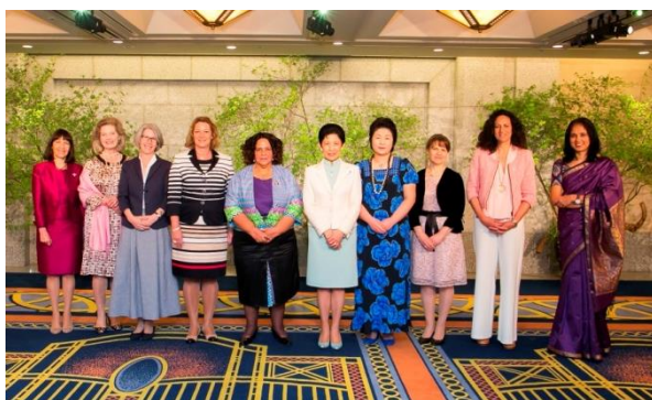
2016年 オープニングセレモニー