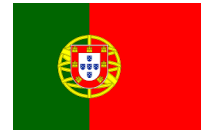
ポルトガル共和国

5月3日(水・祝)11:00～/13:00～/14:30～「ポルトガルタイル絵付け体験」