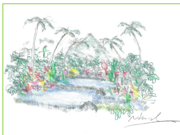
【コスタリカ共和国】

「Ngatu(ンガトゥ)」または、「Tapa(タパ)」と呼ばれる、木の樹皮から作られる高さ3～4mの布を通路の壁画として配置し、布の裏から光を照らすことで、南国の日差しを表現いたします。南国を代表するヤシの木やブーゲンビレア、ハイビスカスなどで彩られた、異国情緒溢れる雰囲気をお楽しみいただけます。