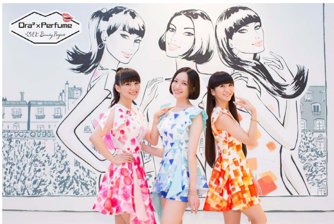
「Ora 2 × Perfume All Day くちもと Beauty」

また、今回のTVCMでPerfumeの3人が着ている衣装と連動した数量限定デザインのオーラツーステインクリアペースト（3香味）が、11月上旬より発売されます。