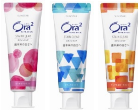
オーラツー ステインクリア ペースト