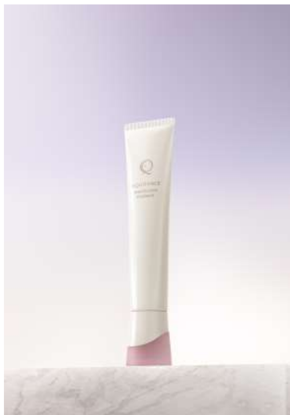
エクイタンス ホワイトロジー エッセンス