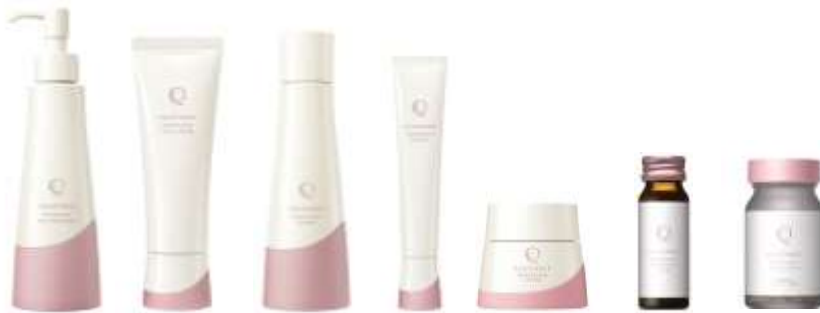
エクイタンス ホワイトロジー シリーズ

「EQUITANCE (エクイタンス)」は今後、様々な役割を担いながら社会で輝く女性に向けて、身体や肌だけでなく、内面からも健やかで美しい状態へ導く商品、サービスを提供いたします。